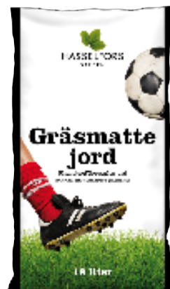
Cirkapris i butik: 55-75 kr

igen hål och ojämnheter. Gräsmattejord används för att renovera mindre gräsytor. Den är svagt gödslad så att det utan problem går att blanda gräsfrö med jorden.